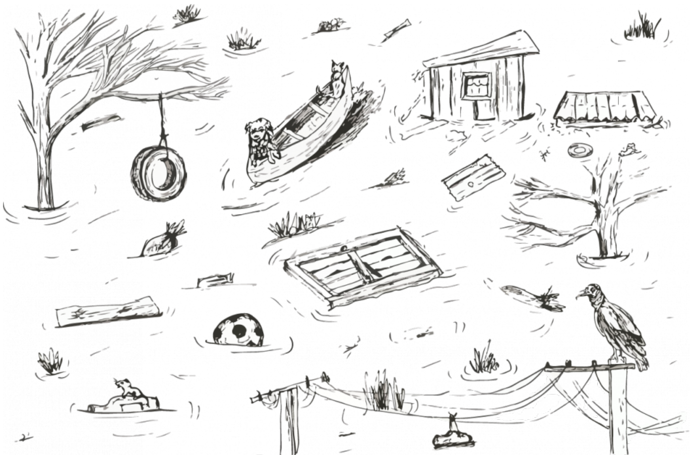
Ilustración: Johanna Espinosa/Jharol Muñoz

Zaz llegué a mi casa y la marca del agua había quedado a un metro de altura en la pared, todos los libros de mi papá, los zapatos, las agendas de mi mamá, todo lo electrónico que fue alcanzado por el agua del caño pasó a ser inservible. Llore que llore; papito, mamita. Las emociones aún no estaban en calma, el desborde de la quebrada la Bermejala estaba en boca de todos, un millar de teorías se murmuraban por todas las cuadras, pero no había pistas de tan magno hecho. Pero el murmullo que nadie escuchaba era el del río que empezaba a aplacarse, tímidamente queriendo decir algo, pero nadie lo escuchó.